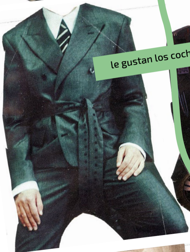
le gustan los coches