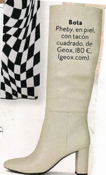
Bota Pheby, en piel, con tacón cuadrado, de Geox, 180 €; (geox.com).