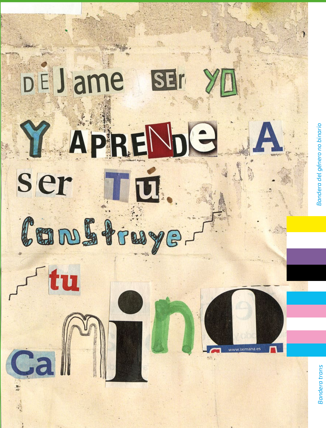
Bandera del género no binario